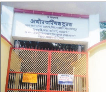
ग्रामीण एवं दूरस्थ अंचलों से आने वाले लोगों के लिए यह शिविर किसी संजीवनी से कम नहीं होगा।

जशपुरनगर। जिले के ग्राम नारायणपुर स्थित जनसेवा अभेद आश्रम एक बार फिर जनसेवा और मानवता की मिसाल पेश करने जा रहा है। अघोर परिध ट्रस्ट एवं बाबा भगवान राम ट्रस्ट के संयुक्त तत्वावधान में स्थापना दिवस के पावन अवसर पर 12 अप्रैल रविवार को एक दिवसीय भव्य निःशुल्क चिकित्सा एवं स्वास्थ्य परीक्षण शिविर का आयोजन किया जाएगा। इस आयोजन को लेकर क्षेत्र में खुशी का माहौल है और बड़ी संख्या में लोगों के पहुंचने की संभावना जताई जा रही है। इस शिविर में विभिन्न चिकित्सा पद्धतियों के अनुभवी और सुविख्यात चिकित्सक अपनी सेवाएं देंगे। मरीजों को एलोपैथिक, होम्योपैथिक सहित अन्य चिकित्सा पद्धतियों के विशेषज्ञों द्वारा जांच, परामर्श और उपचार की सुविधा एक ही स्थान पर निःशुल्क उपलब्ध होगी।