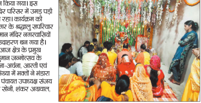
स्थापना का भव्य आयोजन किया गया। कार्यक्रम की शुरुआत विश्रामपुर रेलवे