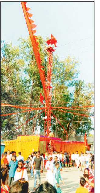
स्थापना का भव्य आयोजन किया गया। कार्यक्रम की शुरुआत विश्रामपुर रेलवे