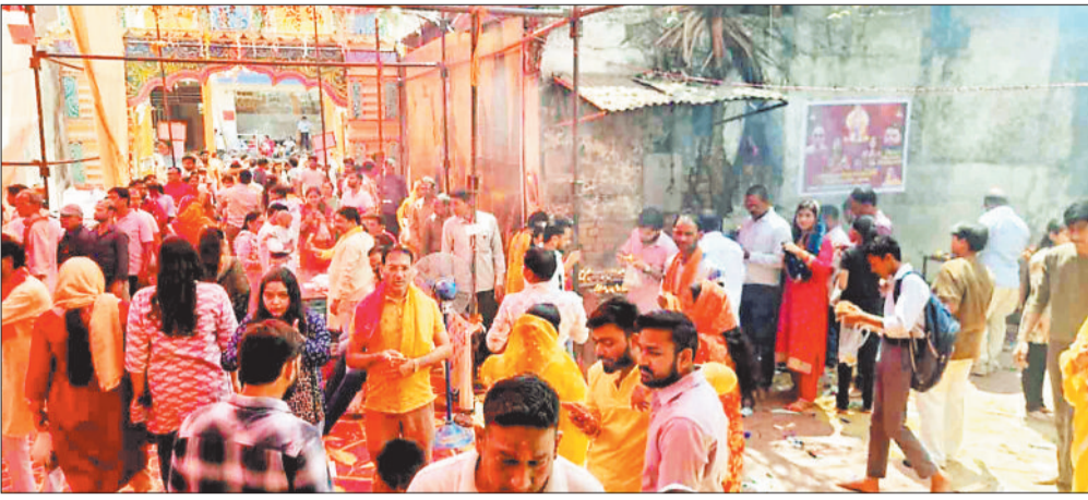
मंदिर में उमड़ी श्रद्धालुओं की भीड़।